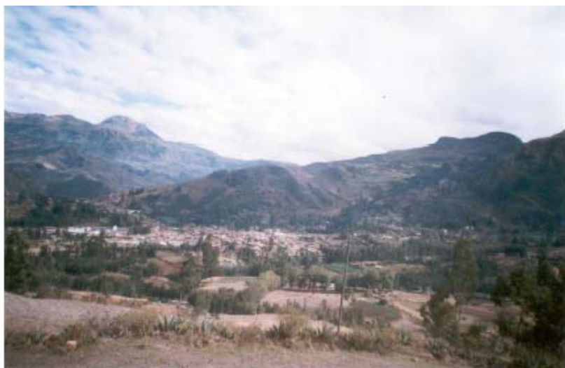
El Rincón Andino: Cachicadán

Al crearse la provincia de Santiago de Chuco, el 25 de octubre de 1900 y promulgada la Ley de Creación el 03 de Noviembre del mismo año, considera a Cachicadán como distrito de nueva creación; en el artículo 1° de la ley de creación, que dice: “Cachicadán, Distrito de nueva creación, formado por el pueblo de Cachicadán como capital, el caserío de Chuca y las haciendas: Sangual, Llaray, el Hospital, San José de Porcón y Angasmarca.”