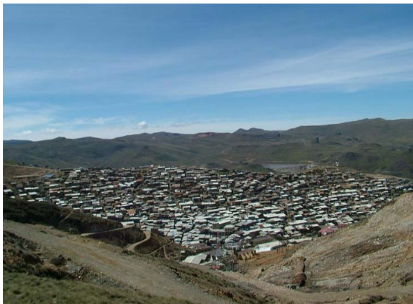
Vista de un sector de la ciudad de Quiruvilca capital del distrito del mismo nombre

Quiruvilca distrito minero, es uno de los más importantes del norte del Perú, cuyo nombre proviene de los vocablos quechuas siguientes: Queru que significa Diente y Vilca igual Plata . He ahí la importancia económica que tiene debido a los minerales que posee.