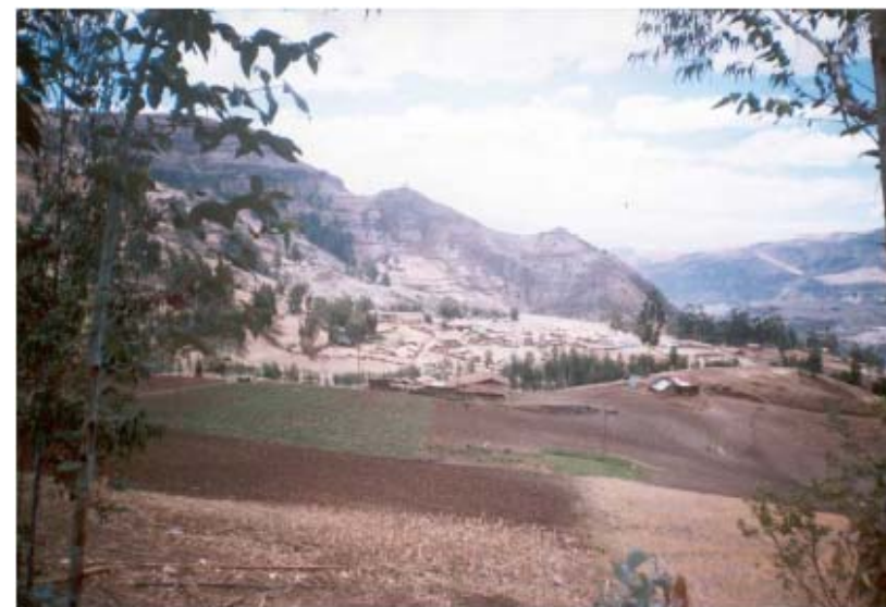
Vista panorámica de Chuca, capital del Distrito de Santa Cruzde Chuca. Al fondo se aprecia el Cerro Huaigatape

Las demás áreas de esta zona, son pastizales para la ganadería; pero no para la agricultura, debido a su clima frío y lluvioso, mucho más cuando es época de invierno y sobre todo los años son lluviosos, los graneros de los temples producen con encomio; mas la zona de las lluvias, si estas son intensas y de duración de dos o tres meses seguidos en el año, los cultivos se pierden en la parte geográfica de Cachicadán. Por ello, que el territorio de temples que hoy pertenece a Santa Cruz de Chuca, que era y son la despensa natural de la población de Cachicadán. Esto no significa sembrar resentimientos, con la población de Chuca, pues nunca hubo ni lo habrá; ambos pueblos son hermanos. Pues, lo mencionado son solamente avatares de los políticos de turno y de personas interesadas de ese entonces, ya que no buscaron equidad ni la debida justicia.