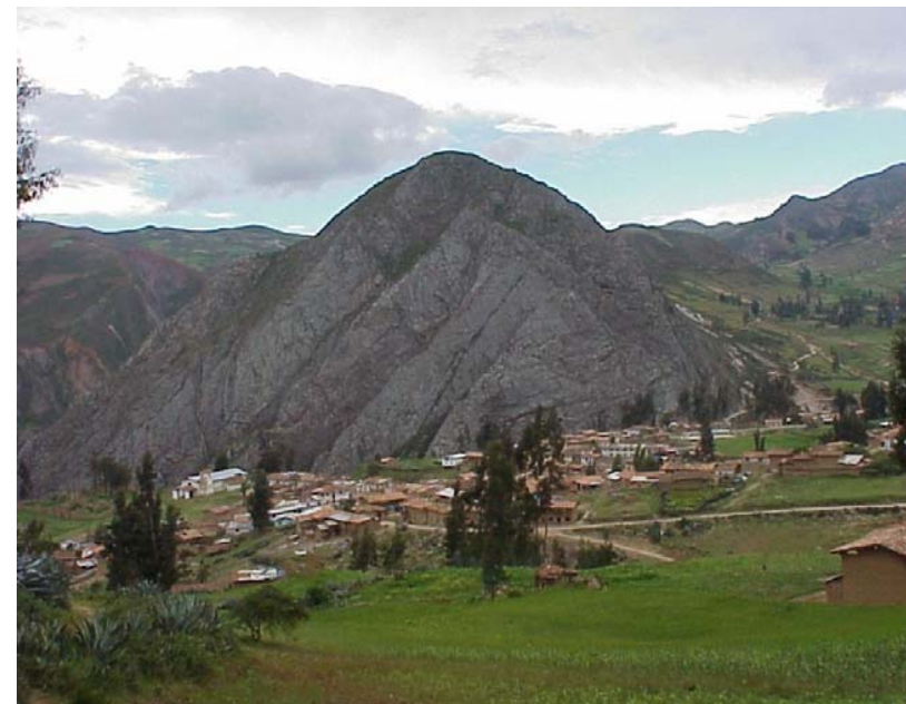
Pueblo de Angamarca, capital del distrito del mismo nombre. Al fondo el Cerro Azul. Que al fundarse Angamarca, determinó que su primer nombre fuera: "Villa Azul"

Este hecho generó para la zona urbana de la ex hacienda, un despegue trascendente, el área urbana comenzó a crecer; debido a la reserva de territorio libre de la Sociedad Agrícola de Interés Social (SAIS) por el Ministerio de Agricultura de ese entonces y exclusivamente destinado a la expansión urbana de la población; generándose luego compra-posesionaria de solares por nuevos propietarios, sus centros educativos escolares se mejoraron; tanto que al llegar a 1980, ya se contaba con un Colegio Nacional Mixto. Estos argumentos nos permiten afirmar, que no era necesidad de declarar a dicha zona urbana con categoría de pueblo; pues esta condición la tenía Angamarca desde tiempo atrás. Prueba de ello lo demuestra sus entidades, por ejemplo su agencia municipal que poseía y que actuaba como especie de Concejo Menor.